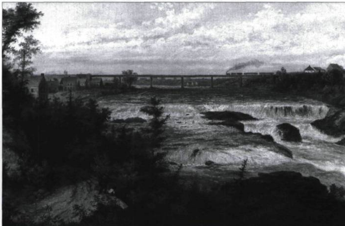
Pont qui enjambe la rivière Etchemin pour la compagnie du Grand Tronc. Peinture de Cornelius Krieghoff, 1858..

une partie du trafic des marchandises et des voyageurs. Les aménagements au port de Québec à la fin des années 1880 pour reprendre le trafic maritime provoquent aussi un ralentissement des activités sur la rive sud. À l'échelle nationale, le déplacement de l'économie vers l'ouest, notamment vers Montréal, affecte considérablement la croissance du port de Québec et en conséquence sa partie sud. On constate en