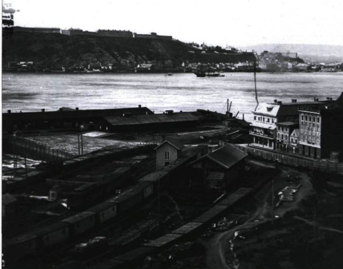
L'anse Tibbits : les installations de la compagnie du Grand Tronc avant 1875.