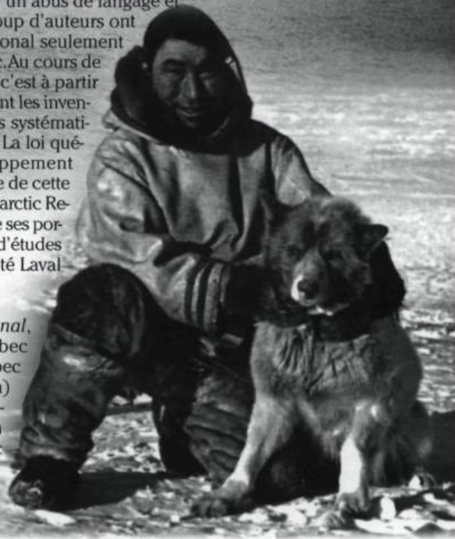
La baie James et les monts Torngat. 1992.

Un Québec septentrional, bien sûr aussi, ou Québec du Nord, Nouveau-Québec (de 1912 à 1975 environ) et Nord-du-Québec (région économique). En longitude, ce Québec vraiment «d'en haut» se trouve vis-à-vis du Québec méridional ; suivant la théorie géopolitique du Secteur, le Sud serait autorisé à projeter son ombre sur le Nord. Ce «royaume», non moins authentique que celui de la Sagamie, compose une vaste péninsule à quatre façades et couvre environ 70 % du tout-Québec ; ainsi, le Québec constitue la province la plus nordique du Canada. En âge d'autochtonie, ce territoire lointain possède peu de milliers d'années de moins que ceux de la vallée du Saint-Laurent. Contrairement à la majorité des expériences humaines du Québec méridional, celles du Nord ont surtout été conduites par les Autochtones. Aussi, le Nouveau-Québec est-il un Québec «autre». Voilà une raison structurelle de l'absence de similitude entre Nord et Sud ; il existe donc une faible cohérence entre les entités laurentienne et boréale ; d'après Z. Nungak, «l'Arctique est plus différent du Sud que la Province ne