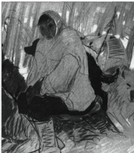
Jeune Trappeur , sérigraphie d'une œuvre de René Richard, réalisée par Louis Desaulniers en 1980.

Ô Nord, ma destinée J'existe soudé à la terre des bouleaux nains, J'existe pour décrire la paix de l'espace que les humains n'ont pas souillée, J'existe pour m'entendre dire «Je t'aime pour la folie», J'existe suintant, tout tremblant, pour pleurer mes amours plus beaux que ma vie. Dos qui ploie, pied qui trépigne, cœur qui saigne, j'existe, ô Nord, ma destinée. ♦