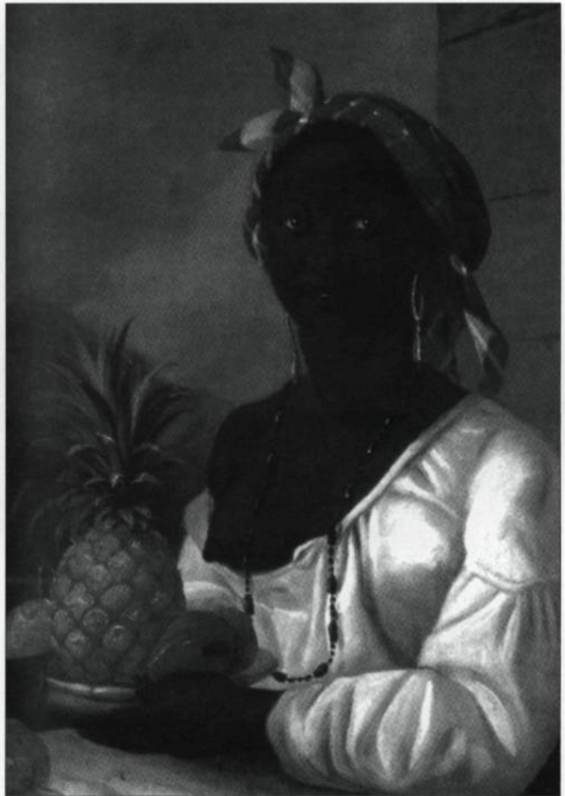
François Malépart de Beaucourt (1740-1794). L'Esclave à la nature morte.

appartenant à des nations alliées aux Français ne pouvaient théoriquement être réduits en esclavage, mais ce principe n'a pas toujours été suivi. Des esclaves issus de ces nations, notamment les Naskapis et les Montagnais ont été recensés. La majorité des esclaves était concentrée dans les villes de Québec, Trois-Rivières et Montréal.