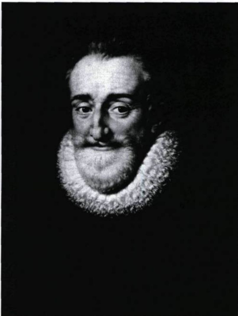
Le 8 novembre 1603, Henri IV, roi de France et de Navarre accorde une commission de lieutenant général à Pierre Du Gua de Mons. ( Mémorial du Québec , tome I, p. 148).

La maison de Du Gua fut la première résidence d'un gouverneur ou gouverneur général au Canada. Celle-ci arborait les armoiries du roi de France. Construite comme les maisons de son époque, sa partie supérieure ressemblait étrangement à celle du Gros-Horloge de Rouen, édifié au cours des années 1527 à 1529. Parmi les autres bâtiments, on retrouvait le logement des charpentiers, des suisses, du curé, des gentils-hommes, une forge, un puits, une cuisine, une boulangerie et une salle publique. Il y avait en tout une vingtaine de bâtiments.