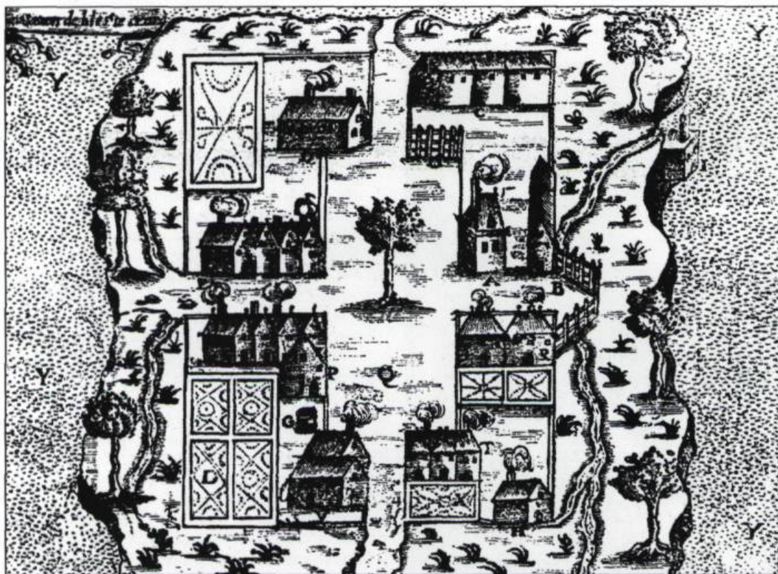
Autre illustration de Samuel de Champlain montrant l'établissement de l'île Sainte-Croix, vers 1604-1605, parue dans Voyages, en 1613.

maintenant de frontière entre le Canada et les États-Unis (Nouveau-Brunswick et Maine). Il choisit celle-ci surtout pour des considérations de sécurité. Dès que son choix fut arrêté, il mit ses ouvriers à l'œuvre et ils commencèrent à construire les différentes bâtisses devant servir de capitale à la nouvelle colonie. Champlain nous laissa un plan détaillé de l'établissement ainsi qu'un dessin des bâtisses qui s'y trouvaient. Cette