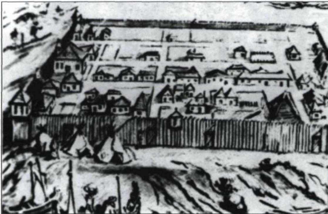
Reconstitution du fort de Pontchartrain, érigé par Lamothe Cadillac.

Pendant une année complète, Cadillac organise sa prise en main personnelle du développement de Détroit. À cette occasion, il bénéficie de l'appui inconditionnel du roi et du ministre. Il demande des hommes de troupe, qu'il entend utiliser à des fins de peuplement en favorisant dans un premier temps leur mariage avant leur départ et leur établissement permanent sur les lieux par la suite. Il veut aussi encourager la migration d'habitants de la colonie en les attirant par le commerce et prédit que par la combinaison de ces stratégies, Détroit deviendra «le Paris de la Nouvelle-France».