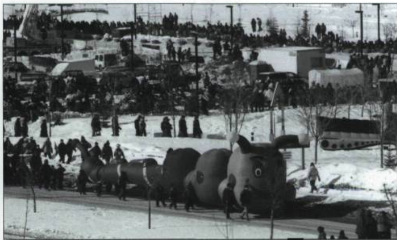
Diverses activités plus contemporaines tenues au vieux port de Chicoutimi durant le carnaval. (Archives du Carnaval-Souvenir de Chicoutimi).

En février 2001, nous commémorerons donc l'an 1901 avec les us et coutumes de l'époque. Près d'une quarantaine d'activités officielles se dérouleront pendant les festivités qui s'étaleront sur une période de 10 jours, soit du 8 au 18 février. Plus de 200 bénévoles, plusieurs artistes-concepteurs et artisans régionaux participeront au succès de cette grande fête hivernale.