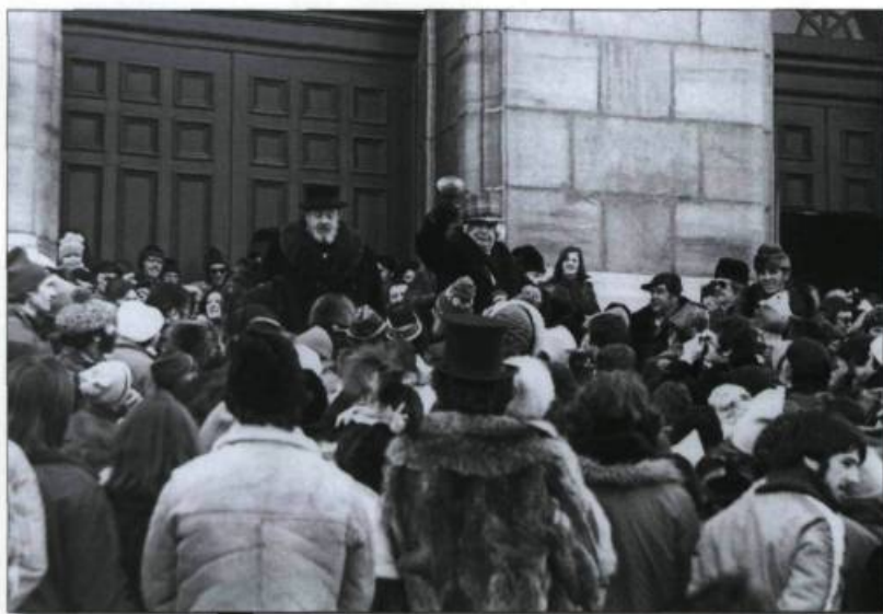
La criée paroissiale sur le parvis de la cathédrale de Chicoutimi, en 1964.