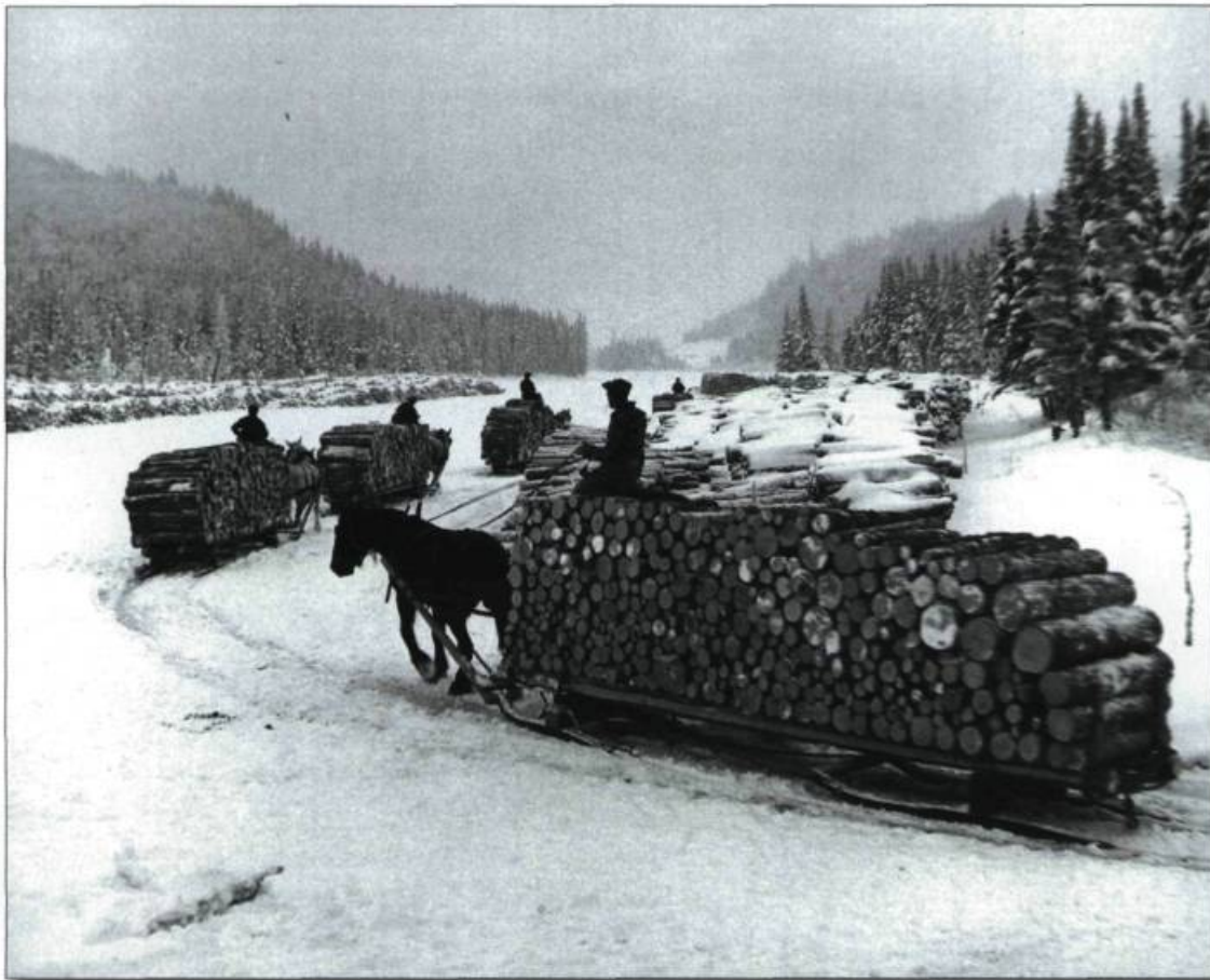
■ Scène de chantier : le transport des billes de bois par sleigh.