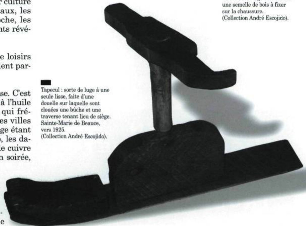
Tapecul : sorte de luge à une seule lisse, faite d'une douelle sur laquelle sont clouées une bûche et une traverse tenant lieu de siège. Sainte-Marie de Beauce, vers 1925.