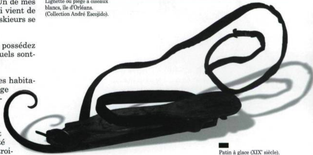
Patin à glace (XIX e siècle). Dispositif constitué d'une lame de fer forgé montée sur une semelle de bois à fixer sur la chaussure. (Collection André Escojido).