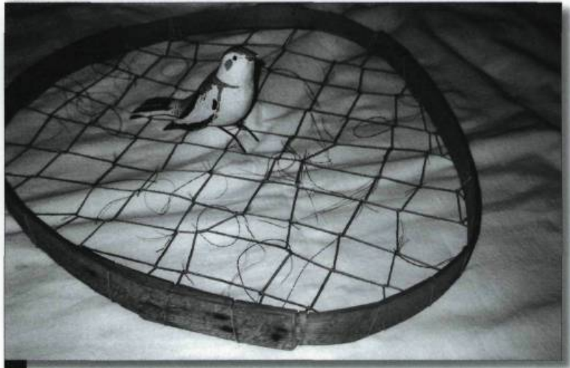
Lignette ou piège à oiseaux blancs, île d'Orléans.

A.E. : Ce travail se faisait à la mi-février en particulier sur la rivière Saint-Charles, à Québec. On utilisait