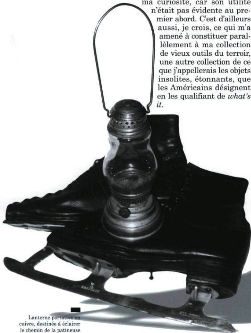
Lanterne portative en cuivre, destinée à éclairer le chemin de la patineuse sur la glace et patins à glace pour dame, de fabrication industrielle (XIX e siècle). (Collection André Escojido).

A.E. : Le premier objet de ma collection, je dirais que c'est une roulette de charron-forgeron. Cet instrument servait à mesurer le bandage des roues des charrettes et des tombereaux. C'est sans doute le premier outil qui m'a intrigué initialement et qui a piqué ma curiosité, car son utilité n'était pas évidente au premier abord. C'est d'ailleurs aussi, je crois, ce qui m'a amené à constituer parallèlement à ma collection de vieux outils du terroir, une autre collection de ce que j'appellerais les objets insolites, étonnants, que les Américains désignent en les qualifiant de what's it .