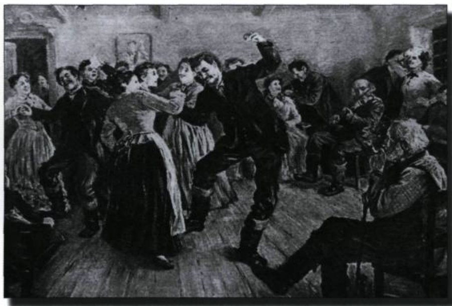
Le Cotillon, illustration de Frederick Simpson Coburn pour The Habitant, nouvelle de William Henry Drummond (1905).

populaire, dans un premier temps en recueillant ces traditions, puis en les transmettant à nouveau à de jeunes, très jeunes publics. Autrefois transmise par la famille, c'est maintenant à la société de prendre le relais si on veut que cette musique continue de fleurir et d'évoluer. L'école primaire doit utiliser davantage ce mode d'expression varié qui comprend des danses, des contes, des chants, accessibles aux enseignants par des stages annuels ou par d'excellentes publications conçues ces dernières années et qui aident les enfants à s'épanouir et à savoir qui ils sont. Demain, les chansons des Spice Girls seront effacées de leur mémoire mais d'autres comme Dans les Prisons de Nantes , Le rossignol gaillard , Les souliers rouges et La fille et la caille resteront gravées à jamais. Une fois l'amour et le respect de cette musique semés, elle germera comme bon lui semble et aura des chances de s'épanouir aux côtés des autres formes musicales.