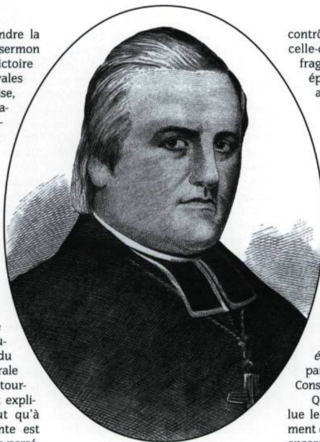
M r Joseph-Octave Plessis (1763-1825). Il fut le onzième évêque de Québec (1807) et le premier archevêque (1809). Gravure tirée de Benjamin Sulte. Histoire des Canadiens français.

Rappelons que Plessis naît en 1763, année où la Nouvelle France devient une colonie britannique, la «Province of Québec». Cette coïncidence est digne d'intérêt dans la mesure où Plessis n'a jamais été que sujet de la couronne d'Angleterre et il est bien possible que ce fait ne soit pas tout à fait étranger aux positions qu'il prendra plus tard en regard de la loyauté à la Grande-Bretagne. Cela reste bien sûr à vérifier, mais il demeure vrai que la plupart des humains appréhendent l'inconnu et s'accommodent mieux de ce qui leur est familier. Ainsi, il se pourrait donc que l'allégeance de Plessis à la couronne anglaise s'inscrive dans cette logique. À 17 ans, il entre au séminaire et peu avant sa consécration, il assumera déjà les fonctions de secrétaire de l'évêque. À partir de ce