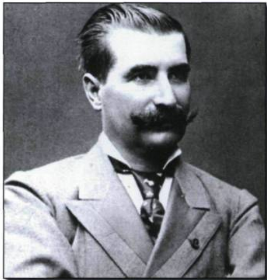
Honoré Mercier (1840-1894). Il succède en 1883 à Henri-Gustave Joly de Lotbinière comme chef du Parti libéral du Québec. En 1885, il fonde le nouveau Parti national regroupant libéraux et conservateurs. Il devient premier ministre en 1887. ( Mémorial du Québec , tome III, p. 346).

On peut considérer que depuis le milieu du XIX e siècle il y a eu quatre partis générationnels au Québec. Le Parti conservateur de George-Étienne Cartier, qui a rallié les électeurs du Québec à la Confédération, semble avoir été le premier de ces partis générationnels. Il a commencé à stagner avec la création du Parti national d'Honoré Mercier, avant d'être remplacé par le Parti libéral de Wilfrid Laurier à la toute fin du XIX e siècle.