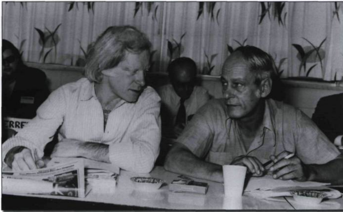
René Lévesque (1922-1987). Membre du Parti libéral en 1960, il sera élu député en 1960 et 1962 dans Montréal-Laurier, puis en 1966 dans Laurier. Il quitte le Parti libéral en 1967 pour fonder le Mouvement souveraineté-association. Il devient président du Parti québécois en 1968. Il sera premier ministre du Québec du 25 novembre 1976 au 3 octobre 1985.

ment du Québec sans interruption pendant 39 ans, se distingue du Parti conservateur par une certaine neutralité envers l'Église, ce qui lui permet d'être plus interventionniste comme l'illustrent en particulier les gouvernements de Lomer Gouin et Alexandre Taschereau.