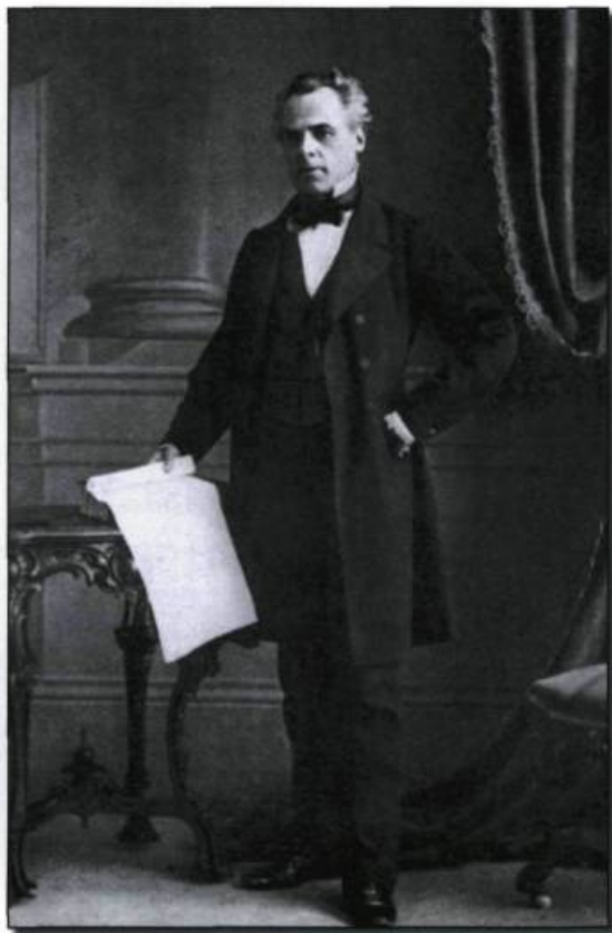
George-Étienne Cartier (1814-1873), ministre dans les différents gouvernements conservateurs qui se succédèrent de 1855 à 1873; premier ministre, avec Macdonald, de la province du Canada (1857-1858 et 1858-1868); porte-parole des Canadiens de langue française pendant plus de vingt ans.

Jusqu'aux années 1930, la domination des libéraux sur les conservateurs est quasi totale, mais l'alliance de l'Action libérale nationale de Paul Gouin avec les conservateurs de Maurice Duplessis, dans une Union nationale, marque la fin du Parti libéral comme parti générationnel. Ce n'est toutefois qu'en 1944 que l'Union nationale émerge véritablement à titre de nouveau parti générationnel et commence une domination de seize ans, interrompue par la victoire libérale de 1960. Il y a bien, en 1966, la fausse victoire de l'Union nationale, due au système électoral, mais ce parti est sur la pente descendante et disparaît complètement au début des années 1980.