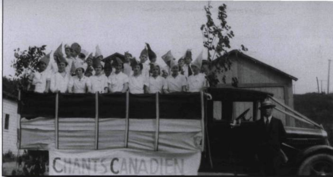
Char allégorique rendant hommage aux chants canadiens lors d'une parade de la Saint-Jean-Baptiste. Carte postale photographique, vers 1930.

Le chant populaire de 1835, Avant tout je suis Canadien , de George-Étienne Cartier, est l'expression du sentiment d'unité qui rallie alors les Canadiens, rassemblés autour de leur premier emblème national, la feuille d'érable. Ces manifestations patriotiques s'inscrivent dans l'intense mouvement de nationalisme, ponctué de luttes politiques, qui a cours au Bas-Canada entre 1800 et 1838. Durant cette période, les articles engagés se multiplient dans les journaux, tout comme les discours enflammés sur la place publique avec des orateurs comme Louis-Joseph Papineau, chef du Parti canadien. Dans ce contexte politique aboutissant à l'insurrection de 1838, porter le nom de Canadien équivalait à une profession de foi :