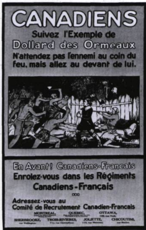
Affiche de recrutement lors de la Première Guerre mondiale qui s'adresse aux francophones du Québec..

L'apparition du mot Canayen , à la même époque, rend compte également du besoin qu'éprouve alors la population du Québec de se redéfinir au moyen d'une nouvelle appellation spécifique. Le mot Canayen , qui résulte de la prononciation relâchée de Canadien , est employé spontanément dans les milieux populaires pour désigner de manière exclusive les Canadiens français, en particulier les individus qui apparaissent comme les représentants les plus authentiques de ce peuple : on parlera ainsi de vrai , de bon Canayen , de Canayen pure laine . Cependant, les connotations négatives dont l'élite intellectuelle investira le mot Canayen vont freiner sa progression.