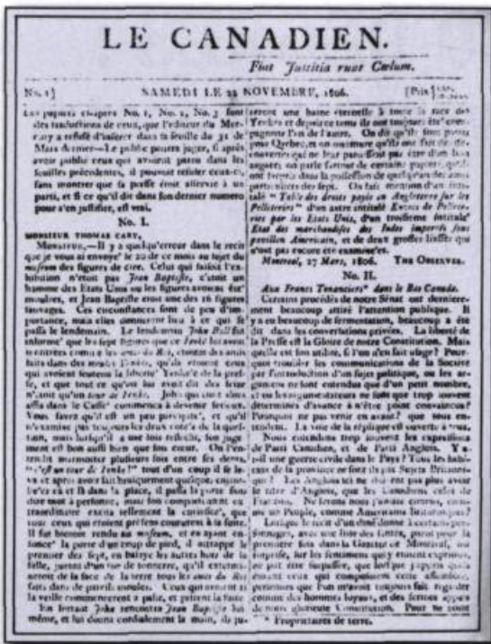
Le journal Le Canadien , fondé à Québec en 1806 par des membres du Parti canadien, avait pour but de défendre les droits et les intérêts des Canadiens français. (Collection privée).

Canadiens et les Français, comparaisons qui sont souvent à l'avantage des premiers, à qui on attribue des qualités physiques et morales flatteuses, même si on leur reproche leur insoumission. L'émergence, au XVIII e siècle, de la locution à la canadienne (dans s'habiller, se battre à la canadienne ) est un autre indice qui témoigne de la reconnaissance des Canadiens en tant que groupe distinct des Français.