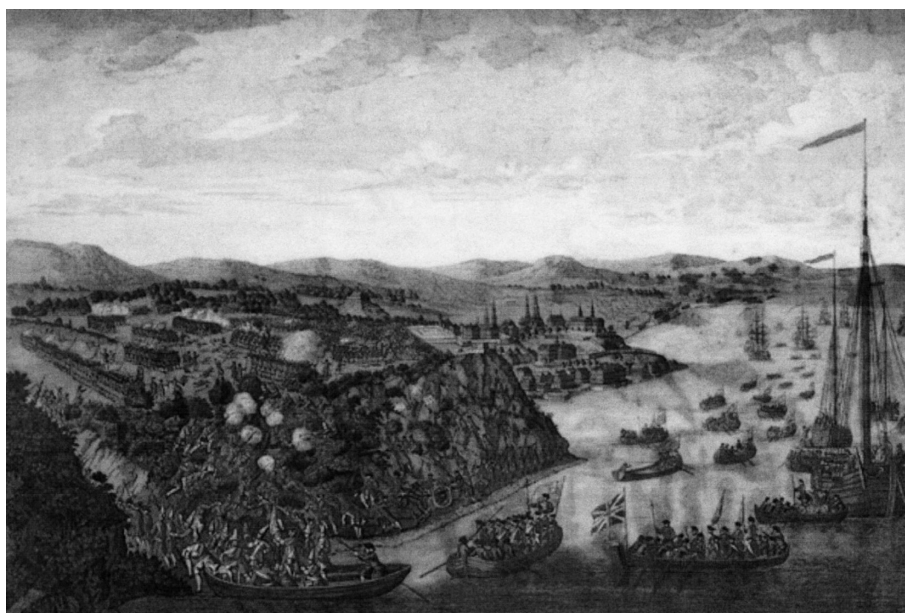
Hervey Smyth, La prise de Québec , gravure, 1797. (Collection privée).

En définitive, la cession de la Nouvelle-France s'inscrit dans une politique coloniale commerciale et non plus impériale. Que les troupes françaises aient réussi ou non à se maintenir dans une partie de la Nouvelle-France, comme le souhaitait Versailles à l'aube de la campagne de 1759, n'aurait rien changé aux négociations menant à la signature du traité de Paris. La bataille des plaines d'Abraham a marqué le début de la fin de la guerre de Sept Ans en Amérique en isolant la colonie et en rendant la paix incontournable. Ce sont toutefois les négociations du traité de Paris qui ont scellé le sort de la Nouvelle-France, dont le rendement économique en fit alors une négligée dans la hiérarchie des colonies. ■