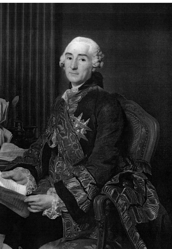
César-Gabriel, duc de Choiseul-Praslin (1712-1785), ministre français des Affaires étrangères de 1761 à 1766. Il signe le traité de Paris de 1763 au nom de la France.

Au terme de la campagne de 1758, les troupes françaises sont conscientes que l'armée britannique ne cesse de se renforcer grâce à sa flotte qui, tout en enserrant la Nouvelle-France, apporte renforts, munitions et vivres. À l'inverse, la disette croissante qui sévit dans la colonie a pour effet de miner la capacité des troupes et le moral de la population. Dès lors, plusieurs craignent pour Québec et le Canada. En octobre 1758, dans un mémoire, l'officier Louis-Antoine de Bougainville se questionne : « Si Québec est pris, le Canada est-il perdu? » et il ajoute : « La colonie peut-elle se soute-