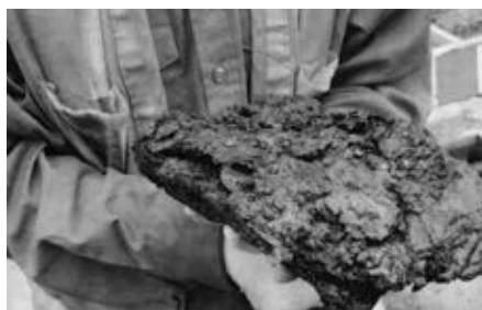
Restes calcinés de plusieurs volumes.

La découverte de quelque 35 fragments calcinés de livres constitue le fait saillant de la campagne de fouilles réalisée à l'été 2013 par la firme Ethnoscop sur le site du Marché-Sainte-Anne-et-du-Parlement-du-Canada-Uni dans le Vieux-Montréal. L'annonce de cette découverte a été faite le 1 er novembre dernier à l'occasion du lancement de la campagne majeure de financement de la Fondation Pointe-à-Callière pour soutenir le Musée et le projet de la Cité d'archéologie et d'histoire de Montréal. Très fragiles, les précieux artéfacts ont été vite envoyés à l'Institut canadien de conservation, à Ottawa, pour évaluer les possibilités de les restaurer à des