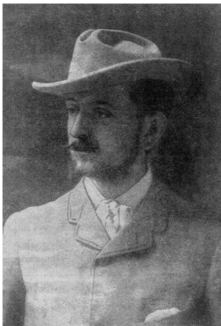
L'Album universel , vol. 19, n° 43, 21 février 1903, p. 1013.

reproduits gratuitement par les revues et les journaux québécois. Ce message doit être porté haut et fort par les associations d'écrivains, à commencer par la Société des écrivains canadiens, fondée à Montréal, en 1936. L'union fait la force et cet effort commun est impératif, indique-t-il dans la préface de ses Boules de neige :