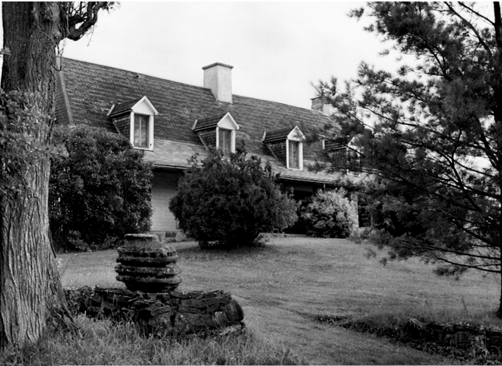
Vue actuelle de l'habitation du Domaine Pointe de Saint-Vallier.