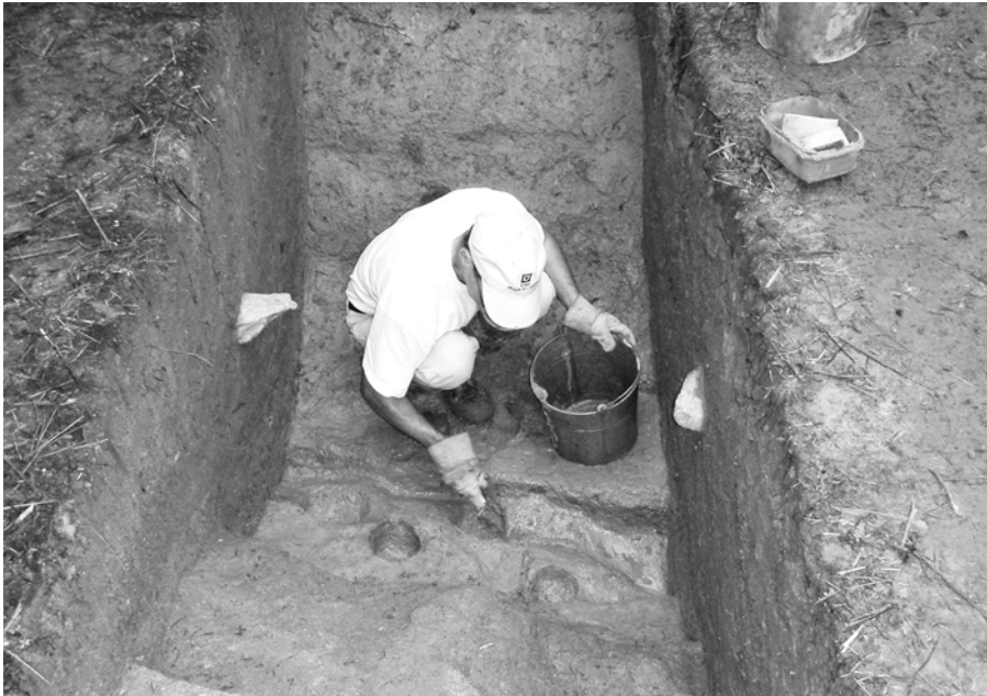
Dégagement des pieux en quinconce de la palissade double du fort Sainte-Thérèse lors des fouilles archéologiques de 2009.

documenter les modes de construction des forts de Sorel et Sainte-Anne, des tranchées creusées dans le sol naturel pour installer les palissades ont été mises au jour dans les trois autres forts. À Chambly, une tranchée d'une largeur d'un pied sur une profondeur d'au moins trois pieds a été découverte sur des segments de courtines et de redans. À Saint-Jean, une étroite tranchée évasée, d'une largeur d'un pied au fond sur une profondeur de deux pieds et demi, traçait le flanc gauche du bastion sud-ouest du fort. Au fort Sainte-Thérèse, les vestiges découverts sur plusieurs segments de l'ouvrage se démarquent. La tranchée d'installation des palissades est plus large (un pied et demi au fond) et plus profonde (quatre pieds) que celles de Chambly et Saint-Jean. De plus, des empreintes de deux rangs de pieux ont été mises au jour. Le fort Sainte-Thérèse, le plus au sud, donc le plus exposé des forts construits en 1665, possédait une palissade de pieux doubles jointifs et disposés en quinconce, appelée palanque. Pendant l'action guerrière, les hommes mobilisés logeaient sans doute sous la