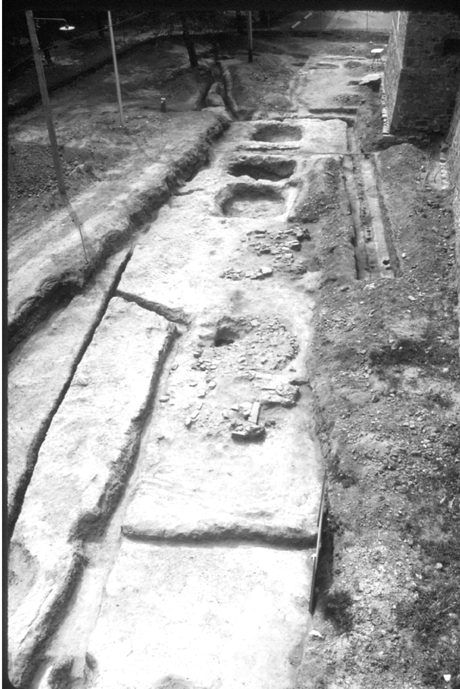
Vue vers l'ouest d'une partie des vestiges associés au premier fort Chambly. Les palissades suivaient le tracé des petites tranchées qui témoignent d'une section de courtine et d'un redan. On aperçoit également les caves et les bases de cheminées des bâtiments qui longeaient la courtine sud.