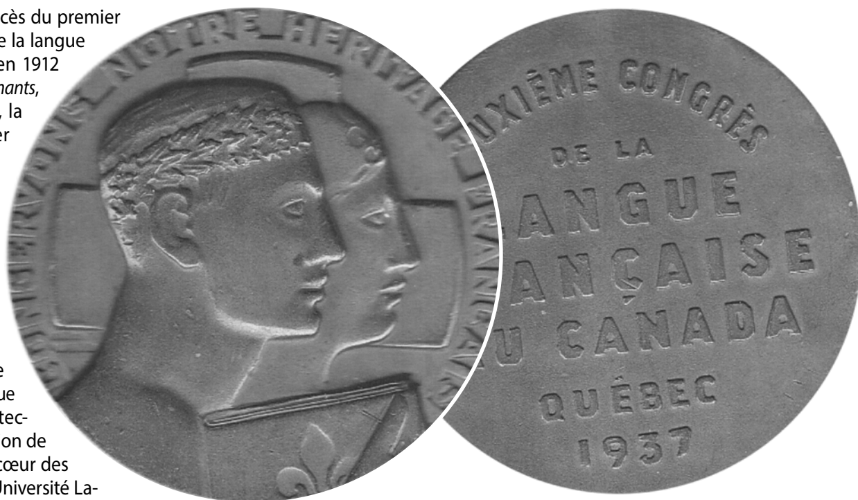
Avers et revers de la médaille du Deuxième Congrès de la langue française, en 1937.

en 1947 et crée, en 1957, le prix Champlain qui vise à encourager la production littéraire chez les francophones à l'extérieur du Québec, en Amérique du Nord. Par ailleurs, dans la foulée de l'adoption par l'Assemblée nationale du Québec, de la Charte de la langue française, en 1977, est créé le Conseil supérieur de la langue française, chargé de donner des avis au ministre sur toute question relative à la langue française au Québec. L'année suivante, le Conseil met sur pied l'Ordre des francophones d'Amérique, ainsi que le Prix du 3-Juillet-1608, et le prix littéraire Émile-Ollivier, attribués annuellement. Lors du deuxième Congrès, le 28 juin 1937, on dévoile deux plaques commémoratives