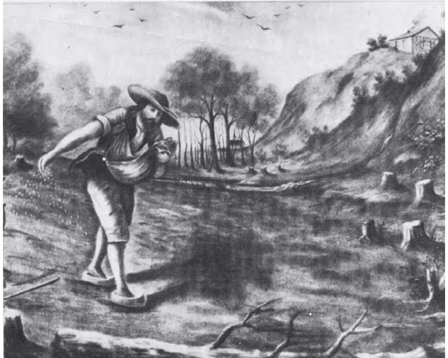
Représentation de Louis Hébert œuvrant comme agriculteur sur les terres de son fief. (Bibliothèque et Archives Canada).

En 1626, quelques jours à peine après l'élévation de Louis Hébert au rang de seigneur, soit le 10 mars, la seigneurie de Notre-Dame-des-Anges est concédée aux pères jésuites, à proximité de Québec et du fief de Lespinay. Louis Hébert