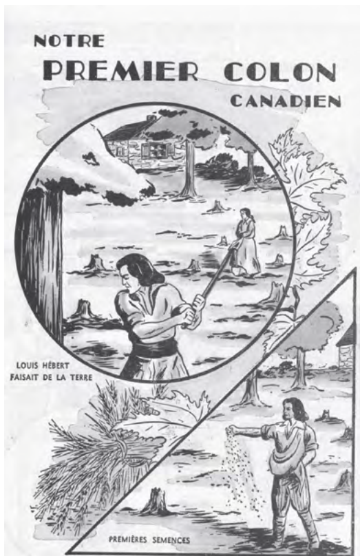
Guy Lavolette. Mon second album d'histoire du Canada. La Prairie , Procure des Frères de l'instruction chrétienne, 1952, p. 25.