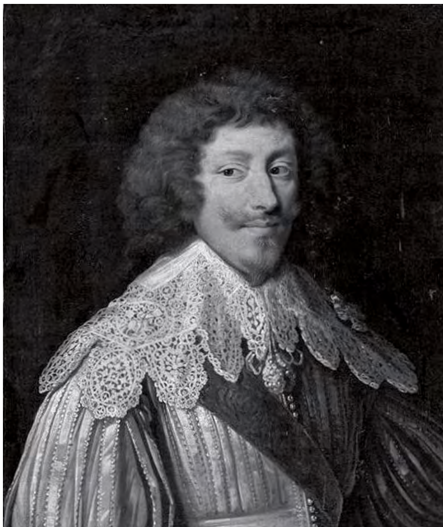
Henri II de Montmorency (1592-1632). Il fut vice-roi de la Nouvelle-France de 1620 à 1624. Œuvre d'un peintre anonyme (Musée de Louvre).

Dans notre histoire, le régime seigneurial est presque systématiquement réduit à sa dimension territoriale, à la manière d'occuper l'espace, voire simplement à une géométrie (les rectangles allongés