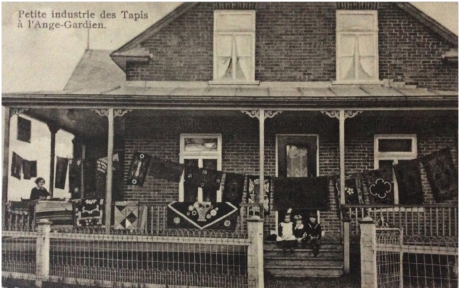
Petite industrie des Tapis à l'Ange-Gardien. Une date, écrite au crayon de plomb au verso : Aug. 4. 1930.

Faire commerce à la maison est une façon de participer à l'économie familiale et une démonstration du travail féminin au quotidien. Pour les passants, on expose ses réalisations : une clôture, une corde à linge ou une rampe de galerie servent de présentoirs.