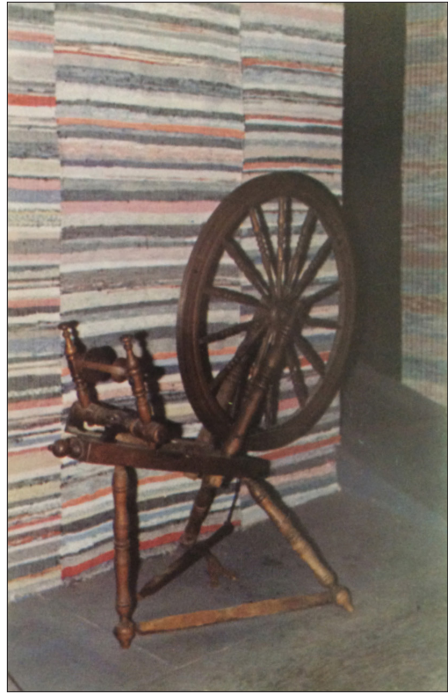
Au verso : Rouet jadis propriété de Éva Bouchard (Maria Chapdelaine) Spinning wheel which served to Éva Bouchard (Maria Chapdelaine). Musée Maria-Chapdelaine Museum. Péribonka (Roberval) P.Q. Canada.