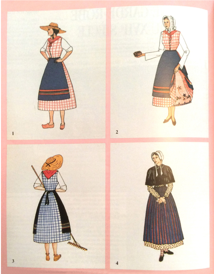
Série de quatre cartes postales reproduisant des dessins de costumes populaires féminins des régions du Québec. Tiré de la revue Cap-aux-Diamants , vol. 4, n° 2, été 1988, p. 70 (Collection Archives de folklore et d'ethnologie, Université Laval, Fonds Madeleine-Doyon-Ferland)