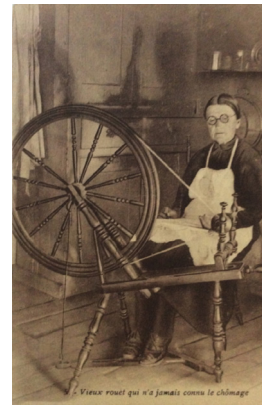
Au verso: Paroisse de la Sainte-Famille, Isle d'Orléans, Montmorency, province de Québec. (Collection Yves Beauregard)

Même dominantes, les femmes ne sont pas absolument seules ; sur les cartes s'y trouvent plus d'une femme, de divers âges, et quelques figures masculines. Les générations collaborent, les aïeules transmettent, les petits apprennent ; du moins, c'est ce qu'on laisse supposer en créant des scènes familiales, surtout autour du métier à tisser et de ses accessoires. L'une file, l'autre tisse et le petit carde. Les femmes âgées sont particulièrement à l'honneur, mais on a soin de présenter aussi des plus jeunes, question de projeter une image vivante et des traditions enracinées, transmises. On cherche aussi à projeter le calme et la sérénité