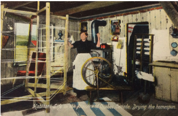
Au verso: Drying the homespun. One of the many operations necessary to produce dainty colored homespuns.

sur l'organisation du travail. On y perçoit en effet un ordre d'opérations de confection textile qui va du filage à la teinture en fil, à l'ourdissage et au tissage sur le métier. Sinon, on pique le canevas ou le tissu pour en faire des tapis et des courtépointes. Icône traditionnelle par excellence, le rouet est largement majoritaire dans les représentations figurées : 22 cartes s'intitulent « femme au rouet », « Spinning », « fileuse à l'œuvre »... ce qui est plus du double des illustrations de métiers à tisser (10). Il est fréquent de présenter une installation fonctionnelle avec un ourdissoir pour préparer le montage en fils du métier.