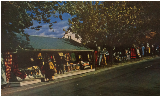
AU VERSO: MAGASIN D'ARTISANAT – QUEBEC, CANADA HANDICRAFT STORE ON ROAD TO STE. ANNE DE BEAUPRE. Natural Color Card From Kodachrome Distributeur Emile Kirouac, 101 St-Roch, Quebec, Canada A. MIKE ROBERTS COLOR REPRODUCTION 1217 BLEURY ST. MONTREAL, Canada Printed in U.S.A.

Sur la rive nord du Saint-Laurent, de la Côte de Beaupré au Saguenay–Lac-Saint-Jean, en passant par Charlevoix, des centres d'artisanat présentent des scènes où l'on prend la pose pour la gent touristique; les protagonistes sont souvent «costumés». Tout le Québec semble couvert, même Montréal où la rencontre vendeuse-cliente est croquée pour les besoins de la cause et comme le montre la série de la Centrale d'artisanat du Québec, branchée sur toutes les régions; chacune des cartes de cette série compte au moins un textile ou un costume que l'on veut significatif: broderie amérindienne pour le Nord-Ouest; couvre-lit, fléché et poupée costumée au Saguenay–Lac-Saint-Jean (Maria Chapdelaine); coussins tissés et appliques pour Montréal; couvre-lit tissé en Outaouais; vêtement tissé en Estrie; courtepointe, sac tissé et fleurs de tissus sur la Côte-Nord; courtepointe, murale et tatting en Mauricie; poupée inuit et bottes feutrées au Nouveau-Québec; linge de table au Bas-Saint-Laurent, Gaspésie. Ces types de productions sont rarement exclusifs à une seule région, mais les pièces choisies annoncent les créations de l'artisanat d'art local 14 .