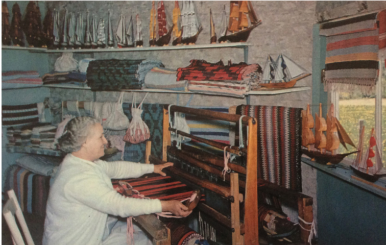
La Gaspésie « En route » (The Spinning Wheel French Canadian Handicrafts Shop, Petit Anse, Prov. Quebec, Canada.) «Au rouet» - Magasin de tissus et Ouvrages à la Main, Petit Anse. Remarquons ici que l'anglais précède le français et qu'il situe le village de Petit Anse pour les touristes attendus. (Collection Yves Beauregard)

Le rouet emblématique donne son nom à une boutique gaspésienne. On y voit une dame d'un certain âge en train de tisser dans la boutique, entourée de catalognes, de tapis, d'aumônières suspendues et de batelets décoratifs donnant le ton à cette région péninsulaire.