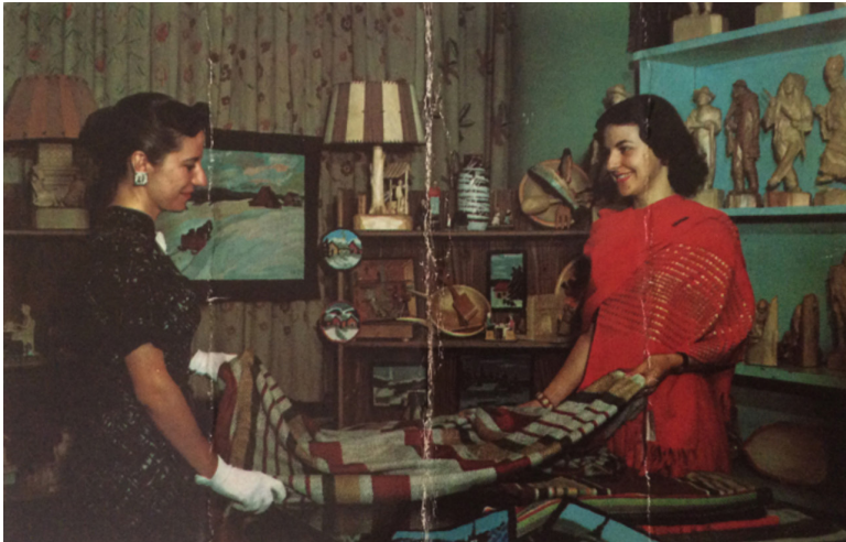
Au verso: Montréal, Canada. Centre de l'Artisanat Canadien. Canada's Centre for Handicraft. 1006-U 16288. Made in U.S.A.