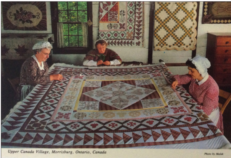
Upper Canada Village, Morrisburg, Ontario, Canada