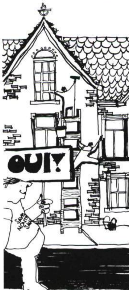
SOS Montréal, octobre 1977. Le mouvement s'engage plus positivement. La promotion de la rénovation et la revitalisation des quartiers s'ajoutent à ses actions de sauvetage.

Les deux premières années, ils luttèrent surtout pour préserver des bâtiments isolés — souvent en requérant leur classement du Gouverne-