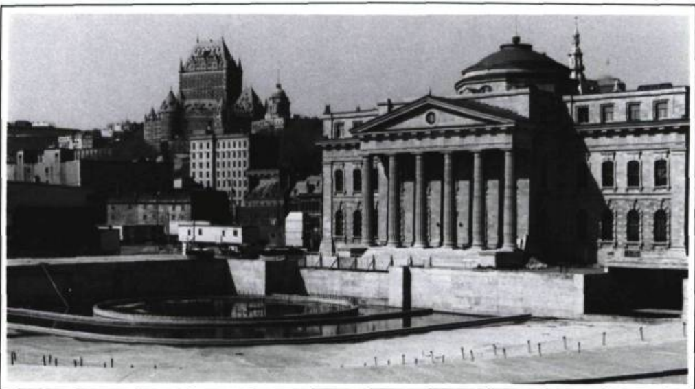
Une vaste «agora» a été aménagée pour attirer les foules. Elle servira à animer artificiellement l'ensemble du Vieux-Port!