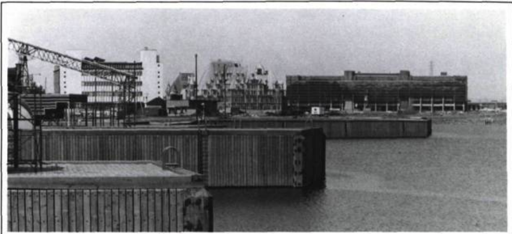
Les infrastructures de plaisance agrémentent le bassin Louise tandis que se dresse à l'arrière-plan le nouveau Palais de justice dans son enveloppe de verre vert voisinant l'ancienne gare du Palais.