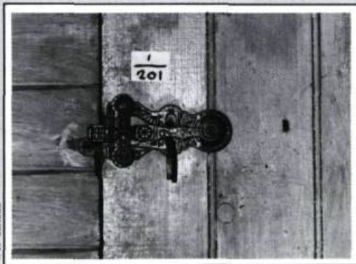
Loquet complet trouvé en place à la maison Saint-Laurent. Il s'agit d'un objet usiné, en fonte, à motifs décoratifs.