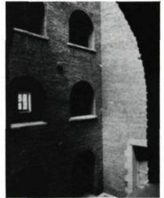
La cour intérieure de la prison des Plaines. «Le respect des divisions intérieures originales de la prison est impératif.»

qui apportent leur aide financière à cette construction de condominiums, vont à l'encontre de leur propre politique de conservation et de mise en valeur de l'architecture ancienne; cela est d'autant plus grave que les démolitions ont lieu à l'intérieur d'un arrondissement historique. Les deux paliers gouvernementaux ont privilégié une rentabilité maximum au détriment du patrimoine; ils ont donc failli à leur devoir de protecteur de notre héritage immobilier, sans compter qu'ils fournissent des armes à l'entreprise privée, qui ne se gênera pas pour les citer en exemple lorsqu'elle voudra agir dans ce sens. ■