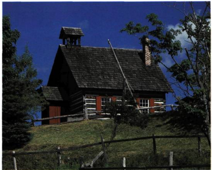
Au sommet d'une colline se dresse l'école de rang (1835), une solide construction en pièce sur pièce qui provient de Lakefield dans l'Outaouais.

La confection de ceintures fléchées fait partie des activités d'interprétation du village Canadiana. La grande ceinture fléchée dite de L'Assomption, au motif «éclairs» et «flammes», est une des plus célèbres traditions de Lanaudière. Elle est d'ailleurs devenue le symbole officiel de la région. Cet artisanat, un des plus admirés au monde, a pourtant failli se perdre. Heureusement, au début du siècle, les ethnologues Édouard Z. Massicotte et Marius Barbeau ont incité les dernières dépositaires de ce savoir à transmettre leurs connaissances. De nos jours, l'art du fléché est très vivace dans Lanaudière. Une association de ses artisans existe depuis 1971 et poursuit des buts de conservation, de promotion et d'enseignement. P.T.