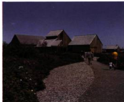
Les bâtiments modernes construits dans le parc respectent eux aussi, par leurs formes, le thème de «l'harmonie entre l'homme, la terre et la mer».

La ferme Blanchette, un établissement agricole typique, procure au visiteur les dimensions humaine et historique qui manquent souvent aux autres parcs nationaux.