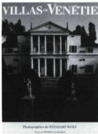
Peter Lauritzen (texte) et Reinhart Wolf (photos). Villas de Vénétie , Paris, Arthaud, 1988, 199 p. (125,00$)

L'habitation bucolique fait partie intégrante de nos valeurs culturelles occidentales. Malgré la primauté des villes et le regain d'intérêt pour les centres-villes, la campagne conserve intacts son pouvoir de séduction et son aura de bien-être et de sérénité. Ainsi la villa palladienne et, par ricochet, les villas vénitienes en général, chaînon essentiel dans l'évolution de ce type de résidence, suscitent toujours l'intérêt.