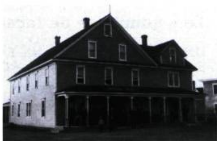
L'hôtel Dominion, vers 1910.

« RENCONTRE DE DEUX RIVIÈRES », EST LE SYMBOLE D'UNE ACADIE FIÈRE ET TENACE. CETTE VILLE CONJUGUÉE À LA MER ARBORE AVEC DIGNITÉ SES ORIGINES MARQUÉES PAR LE DÉFI DE SURVIVRE.