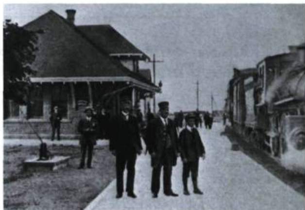
La gare de l'Intercolonial à la fin du siècle dernier.