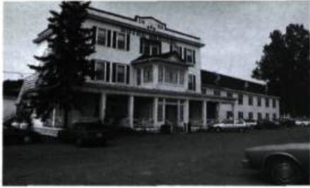
L'hôtel Shediac, datant de 1853.