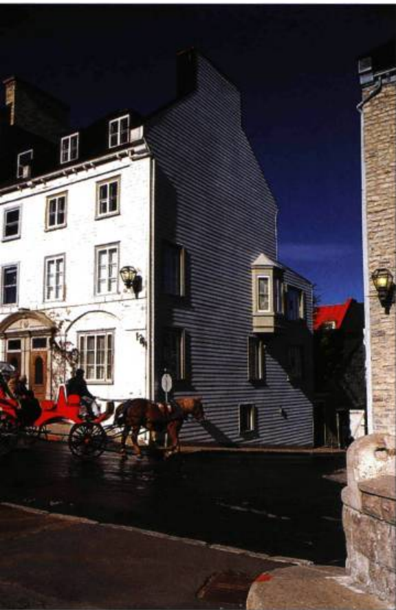
À la fin du XVIII e siècle, la Haute-Ville intra-muros (ici à l'angle des rues des Grisons et Saint-Denis) est devenue un quartier huppé.

la moitié d'entre elles font même moins de 45 mètres carrés. Les demeures spacieuses représentent des exceptions.