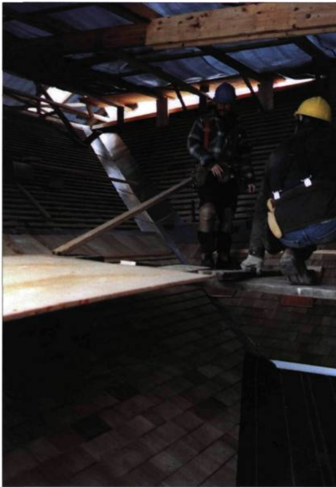
Les ouvriers travaillent à la consolidation de la structure du toit de l'annexe du manoir.