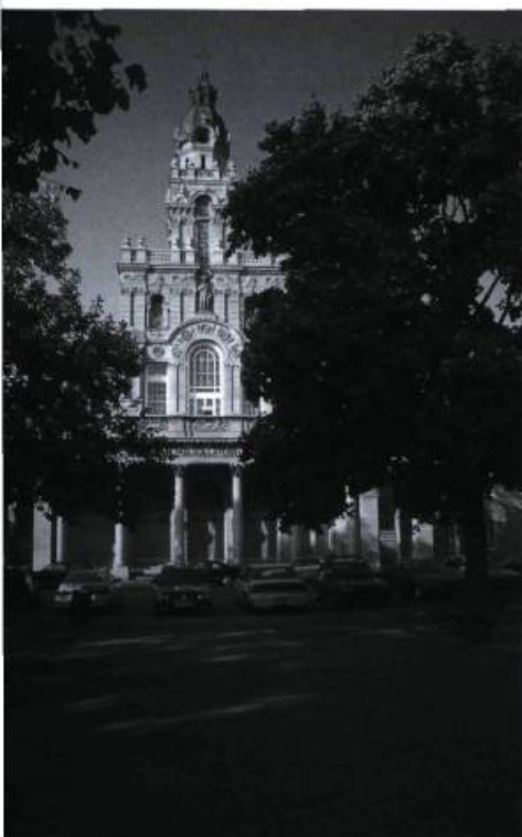
Jos. Venne a réalisé la façade et le transept de l'église Saint-Enfant-Jésus du Mile-End sur le boulevard Saint-Laurent.