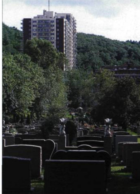
Le développement du cimetière Notre-Dame-des-Neiges inquiète les organismes de protection du mont Royal.

La firme d'architectes Beaupré & Michaud, mandatée pour étudier les possibilités du site, a proposé cinq hypothèses: vendre une partie du site à la Ville pour en faire un parc, vendre L'Ermitage (un immeuble du site), louer une partie des autres édifices, creuser un stationnement souterrain ou construire des immeubles résidentiels