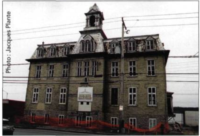
Les travaux de restauration ont peu modifié l'enveloppe extérieure du Vieux-Couvent. Toutefois, la maçonnerie, la tôle et les boiseries ont exigé d'importantes réparations.