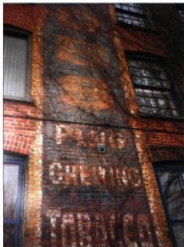
Marie-Élaine Boily, 13 ans, a saisi à sa façon toute une époque en photographiant cette enseigne de l'Imperial Tobacco sur les murs d'une usine des années 1940 à Granby.

Information : (418) 644-9841 ou 1 888 497-4322.