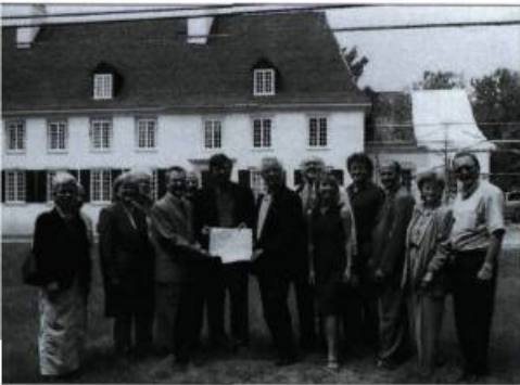
Les récipiendaires des prix et les intervenants de l'île d'Orléans.