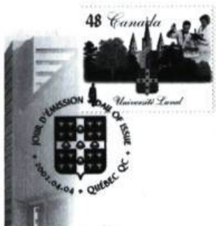
Timbre commémorant les 150 ans de l'Université Laval.

L'Université Laval est la toute première université francophone à avoir vu le jour en Amérique. Ses origines remontent à aussi loin que la fondation du Séminaire de Québec par M re François de Laval, en 1663. En 1852, l'institution obtenait sa charte et devenait la source de tout enseignement supérieur de langue française au Québec, au Canada et en Amérique. Ce double anniversaire, 340 ans et 150 ans, est célébré jusqu'en mai 2003. À l'occasion de ces festivités, un vibrant hommage au père Georges-Henri Lévesque s'est déroulé le 14 août dernier. L'influence sociale du père Lévesque, fondateur et premier doyen de la faculté des sciences sociales à l'Université Laval, est largement reconnue. Un monument, un livre hom-