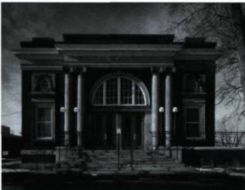
Le Douglas Memorial Hall.