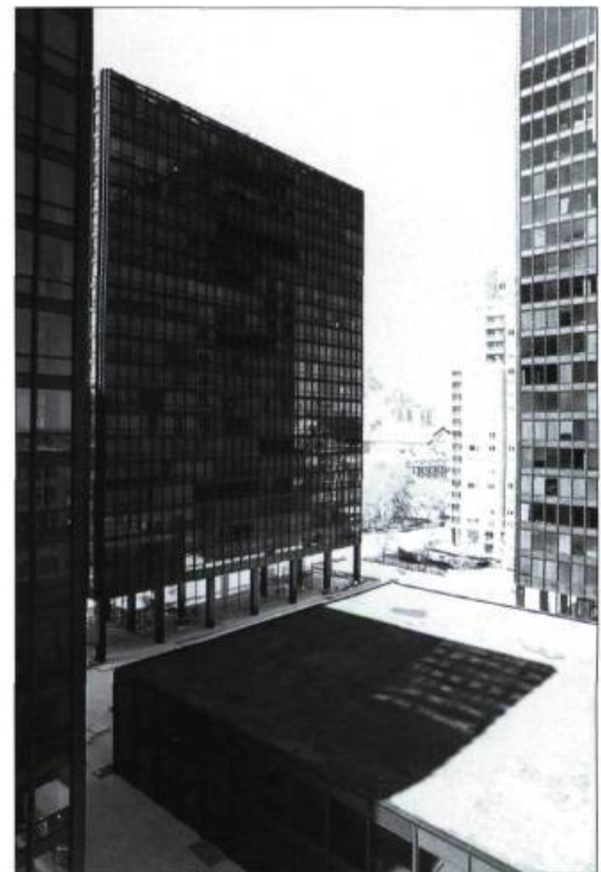
Le Westmount Square, une œuvre de Ludwig Mies van der Rohe, a été construit entre 1965 et 1968. Les deux immeubles d'habitation et la tour à bureaux sont semblables et présentent un jeu de volumes proportionnés et équilibrés, distribués d'une façon stricte.

France Vanlaethem est directrice du DESS en Connaissance et sauvegarde de l'architecture moderne à l'École de design de l'UQAM. Elle est également présidente de DOCOMOMO Québec.