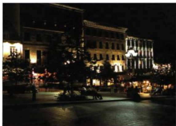
La place Jacques-Cartier.