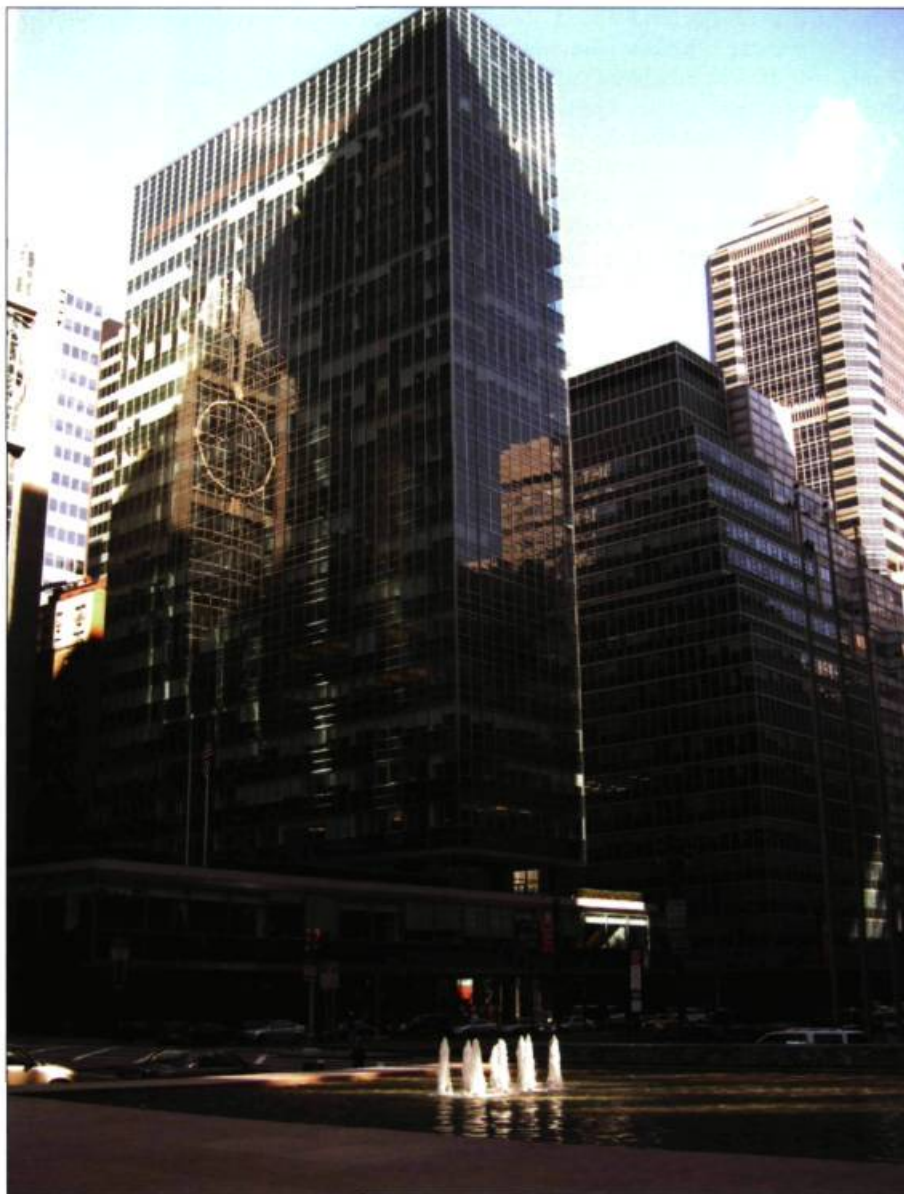
Le mur extérieur vert d'eau de la Lever House (1950-1952), située sur Park Avenue à New York, a fait l'objet d'une restauration exemplaire.

D epuis bientôt 20 ans, nombre d'auteurs ont exploré la spécificité du patrimoine moderne. Plusieurs ont souligné les problèmes de vieillissement prématuré des bâtiments novateurs construits au XX e siècle. Ces problèmes