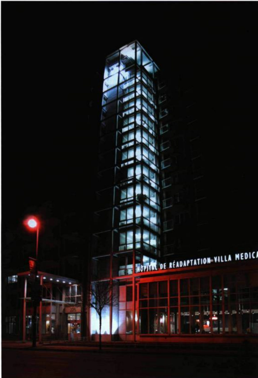
L'hôpital de réadaptation Villa Medica, sis au 225, rue Sherbrooke Est à Montréal, a été rénové avec sensibilité par les architectes Boutros et Pratte.

surélevant de quelques étages les édifices qui bordent les rues Cathcart et Mansfield, ensuite de gazonner l'esplanade minérale au pied de la tour, dans l'axe de l'avenue McGill College et du mont Royal.