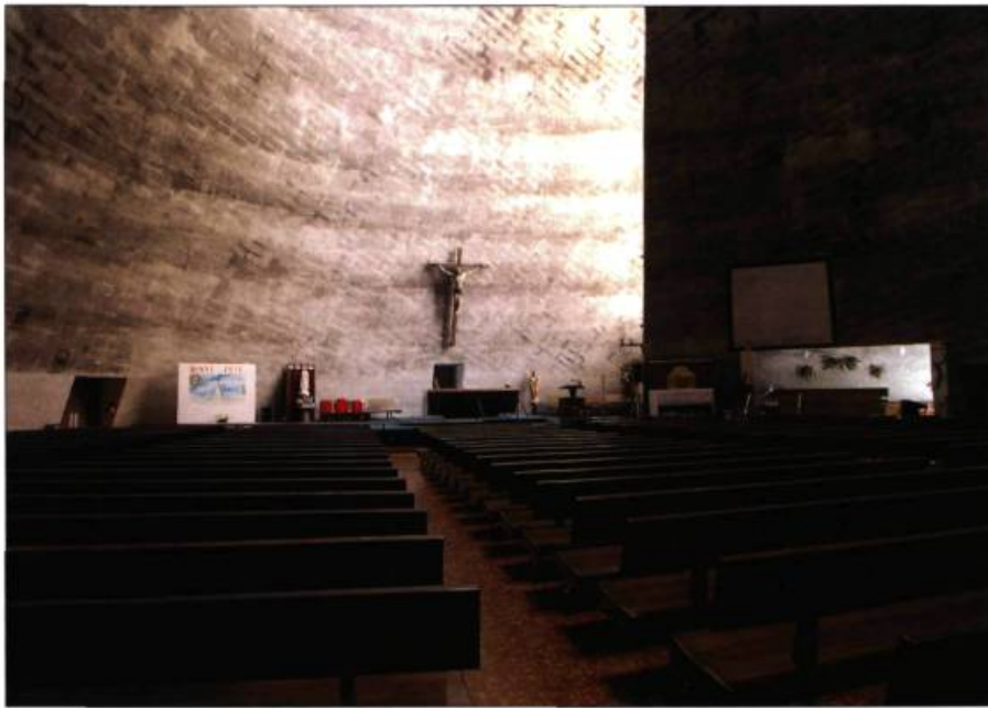
Effets lumineux concentrés, ampleur du volume et dénuement sont autant de caractéristiques de l'intérieur de l'église Notre-Dame-de-Fatima.