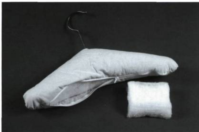
En conservation des textiles, la bourre de polyester peut être utilisée comme élément matelassant pour les cintres et les mannequins.