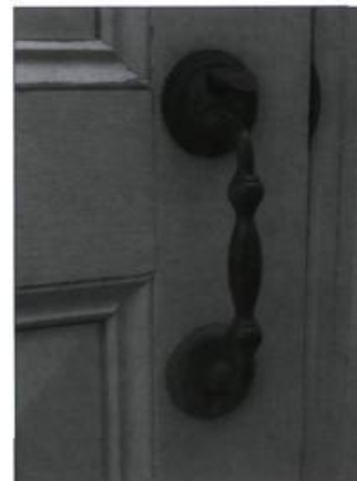
Le fer a aussi été utilisé, et de belle façon, pour des éléments de quincaillerie on ne peut plus usuels, comme c'est le cas pour cette poignée de porte.

Le cuivre, au contraire, a été l'un des premiers métaux utilisés: son emploi remonte à plusieurs millénaires avant