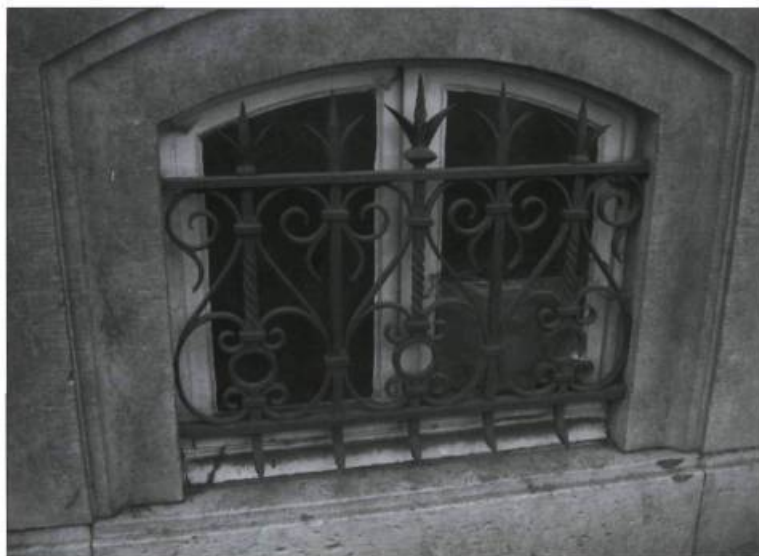
Jolie grille de soupirail en fer forgé.