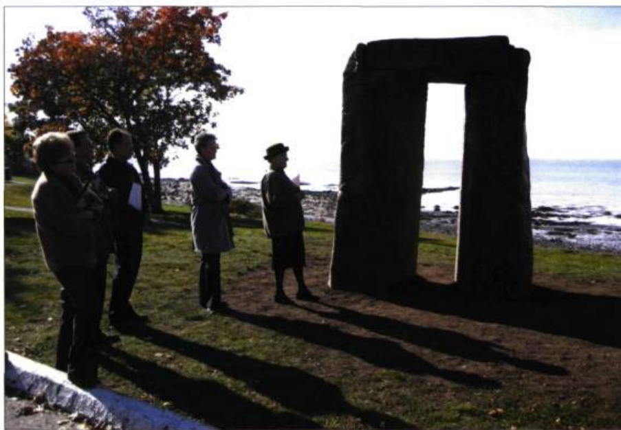
Un exemple de sculpture particulièrement bien intégrée à son environnement historique et paysager : Passage , de Tatiana Démidoff-Séguin.

Le premier consiste en la conception artistique de colonnes d'affichage. L'artiste loupériovis Youri Blanchet a réalisé un design de colonne Morris en s'inspirant du patrimoine architectural local. Le traitement du toit rappelle le rôle à