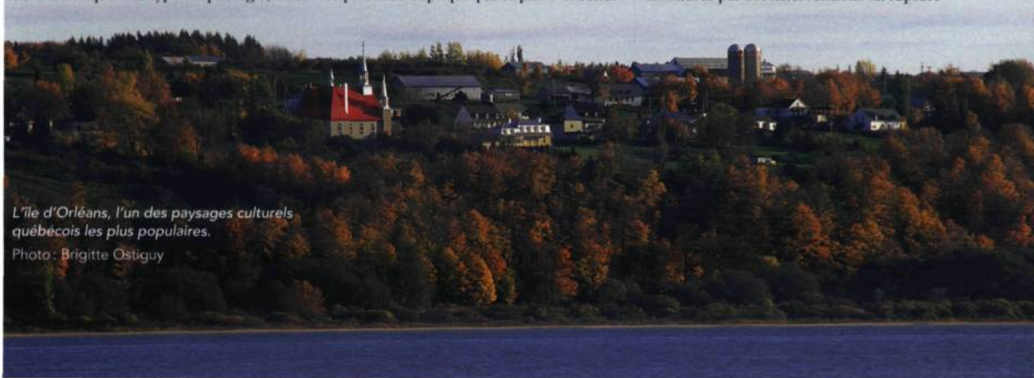
L'île d'Orléans, l'un des paysages culturels québécois les plus populaires.

Restaurer l'identité de paysages culturels dénaturés par des interventions en rupture