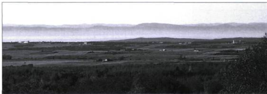
La topographie et l'occupation du territoire de la MRC offrent des vues étendues sur la plaine agricole et le fleuve Saint-Laurent à partir des villages du piedmont des Appalaches, comme ici, à Saint-Paul-de-la-Croix. Certains points de vue permettront de voir les 134 éoliennes du projet de SkyPower en même temps.