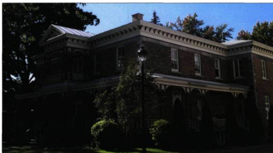
Le presbytère, tel qu'on peut le voir aujourd'hui, a conservé l'authenticité de ses détails architecturaux.