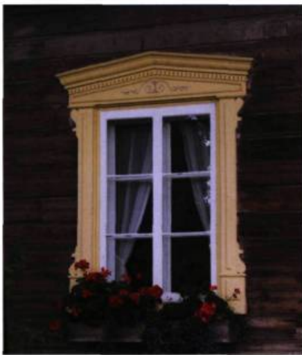
Grâce au choix de photographies disponibles sur le site Internet, on peut apprécier certains détails architecturaux qui accentuent la personnalité d'un bâtiment.