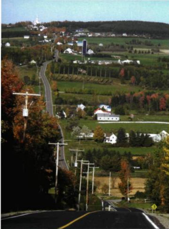
Vue de Sainte-Agathe-de-Lotbinière.