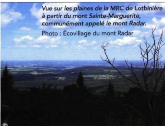
Vue sur les plaines de la MRC de Lotbinière à partir du mont Sainte-Marguerite, communément appelé le mont Radar.