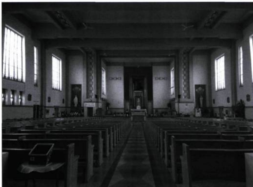
Vue d'ensemble vers le chœur du lieu de culte.

Présentement évalué à 10,5 millions de dollars, ce projet serait financé en partie par le ministère de la Culture, des Communications et de la Condition féminine, grâce aux subventions accordées pour les bibliothèques et à celles octroyées à une municipalité pour les bâtiments patrimoniaux qu'elle cite.