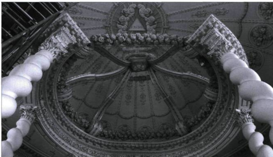
Une vue en contre-plongée accentue la forme elliptique du baldachin.