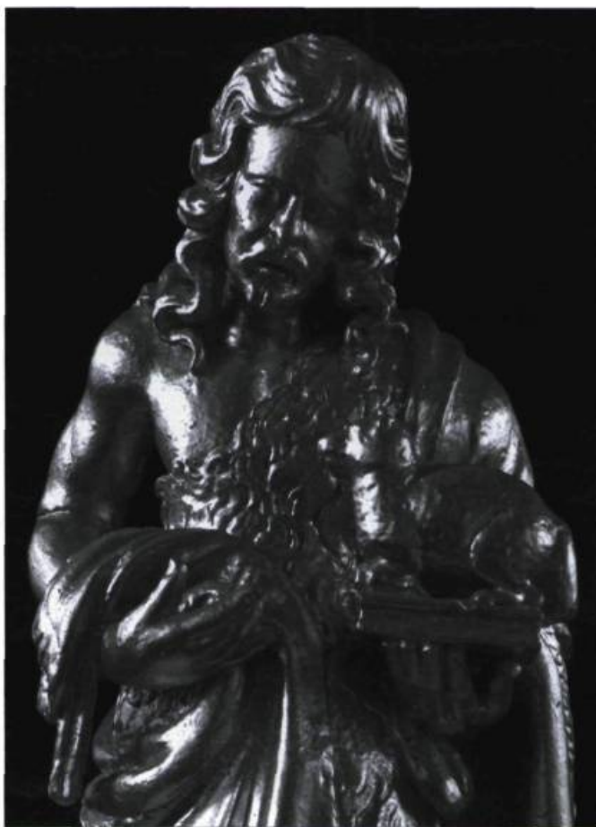
Maintenant recouverte de dorure, la représentation de saint Jean-Baptiste était autrefois polychrome.