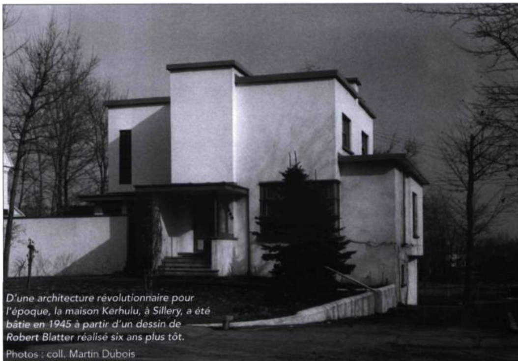
D'une architecture révolutionnaire pour l'époque, la maison Kerhulu, à Sillery, a été bâtie en 1945 à partir d'un dessin de Robert Blatter réalisé six ans plus tôt.