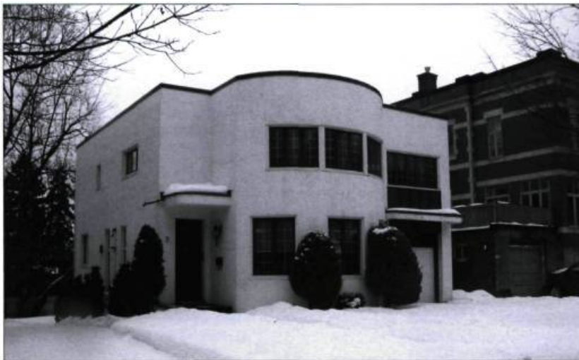
Avec le modernisme, aucune ornementation superflue n'est ajoutée, ce qui permet d'apprécier l'expressivité des matériaux et des assemblages. Ici, la maison Beaudry-Leman à Outremont.

répertoire formel afin d'intégrer les nouvelles méthodes de travail et les nouveaux matériaux. Ils souhaitent traduire le dynamisme de l'époque.